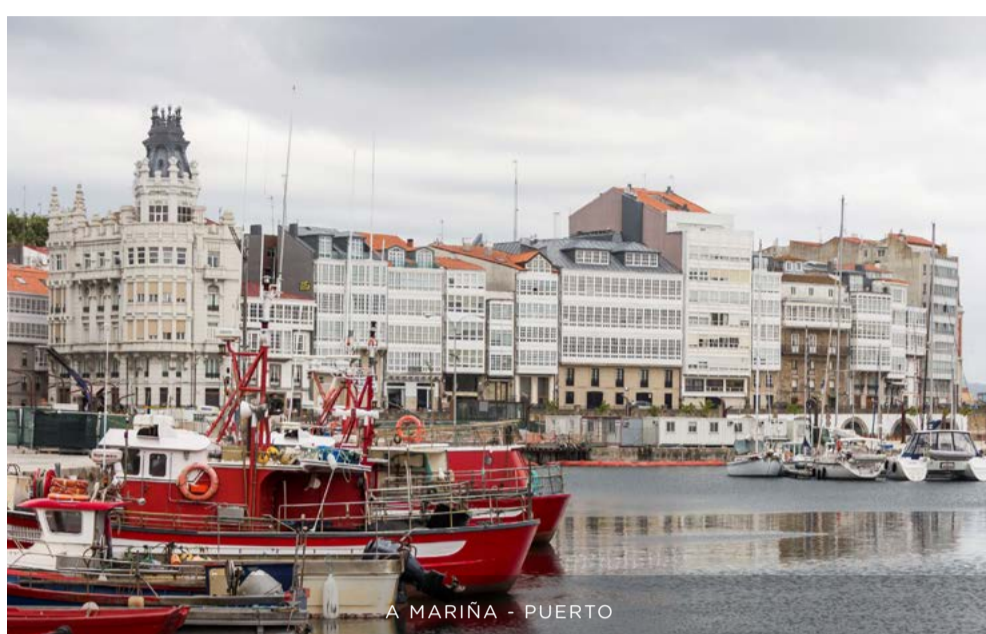
A MARIÑA - PUERTO

A Coruña es Galicia y es Atlántico. Nuestro mar y nuestra tierra nos ofrece una variada gastronomía que enamora a todo aquel que nos visita.